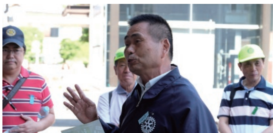
■実行委員長挨拶：大仁田委員長

3回目となる歩こう会。年々参加人数が増え、大変盛大となっております。東村山の豊かな自然の中を満喫してください。