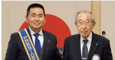
■バギオ基金御礼状 樺澤会員